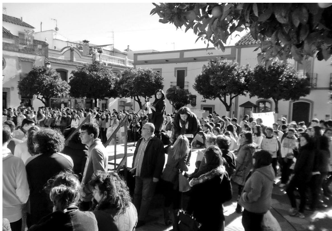
La Plaza se llenó de estudiantes el 25 de Noviembre